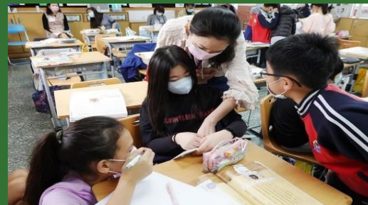
一中一外雙導師制