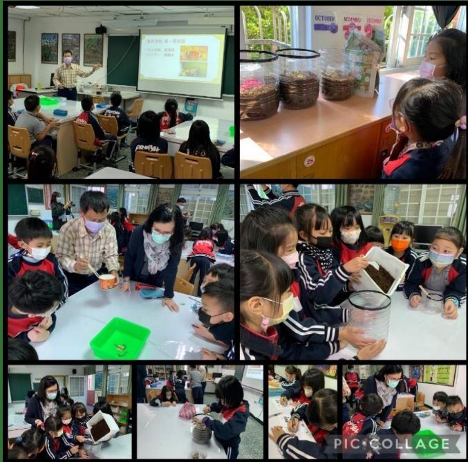
探索體驗、合作學習