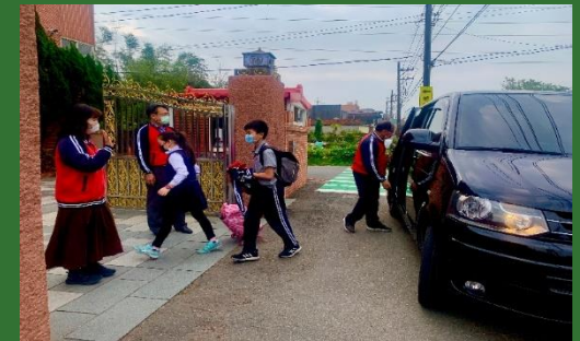
交通接送、下課導護